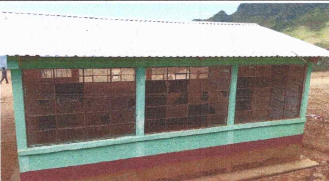
Foto 5: se observa fotografía con pintura deteriorada en espacio exterior