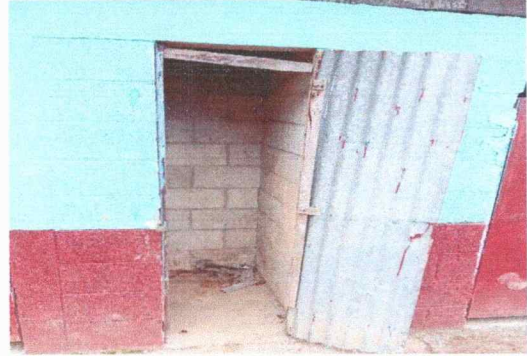
Foto 2: En esta fotografía se observa que el sanitario se encuentra en mal estado tanto techo y puerta.