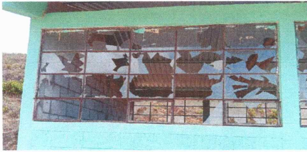
Foto 1: En esta fotografía se observa el deterioro de los vidrios en 4 aulas y dirección