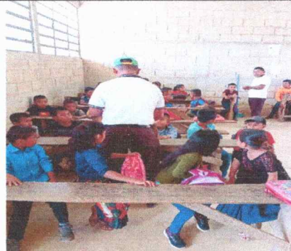
Foto 6: fotografía donde se muestra la falta de pintura en parte interior de las aulas.

Observación: Si es necesario se pueden agregar hojas adicionales y actualizar en las hojas.